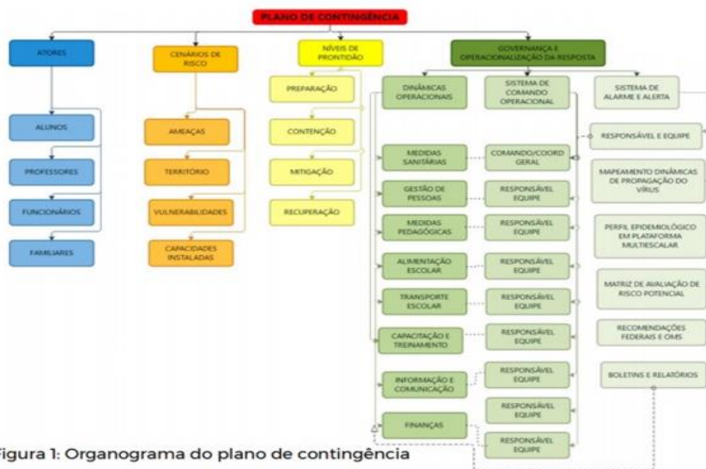
Figura 1: Organograma do plano de contingência

A estrutura do PLANCON-EDU do Colégio Raízes obedece ao modelo conceitual ilustrado na Figura 1.